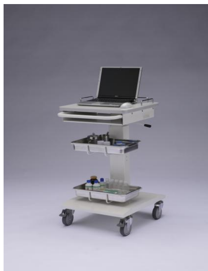
オプション装着例