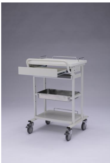
オプション装着例