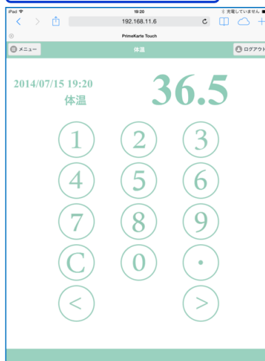
バイタル入力画面 (例)