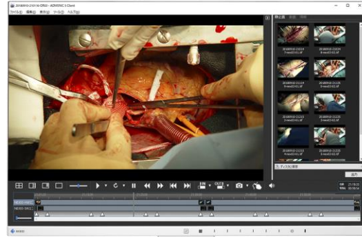
ADMENIC Client Software