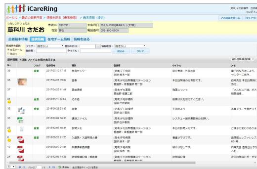
患者情報共有画面

5) 標準化への対応状況、未達成の場合対応予定および対応のための追加費用の有無：